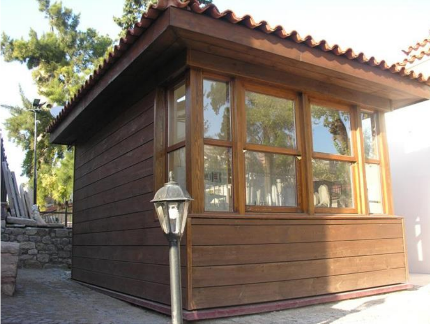
Koskoca Emir Sultanda, Abdest alınacak bir çeşme dahi bulunmamaktadır.