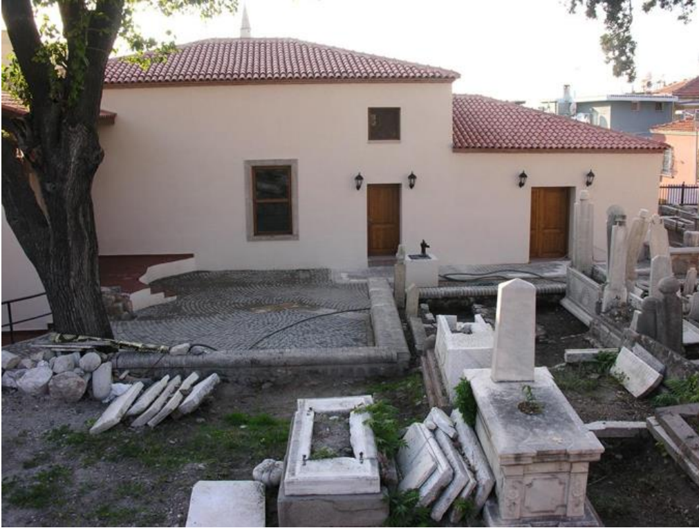
Haziirede bulunan mezar taşları tarihe ışık tutan en önemli belgeler niteliğinde olmasına rağmen bir çoğu bu restorasyon sırasında kırılmış ve sağa- sola atılmış durumdadır.

Emir Sultan Haziresinin sırta dönüşen KİTABESİ nerededir? Bilen – Gören var mıdır, bu kitabenin başına neler geldi, nasıl ortadan kayboldu, hangi yetkili çıkıp açıklayacak? Yetkililere sesleniyorum, şu kitabeyi çıkarın ortaya da tarih ve insanlık adına doğru bir iş yapın.